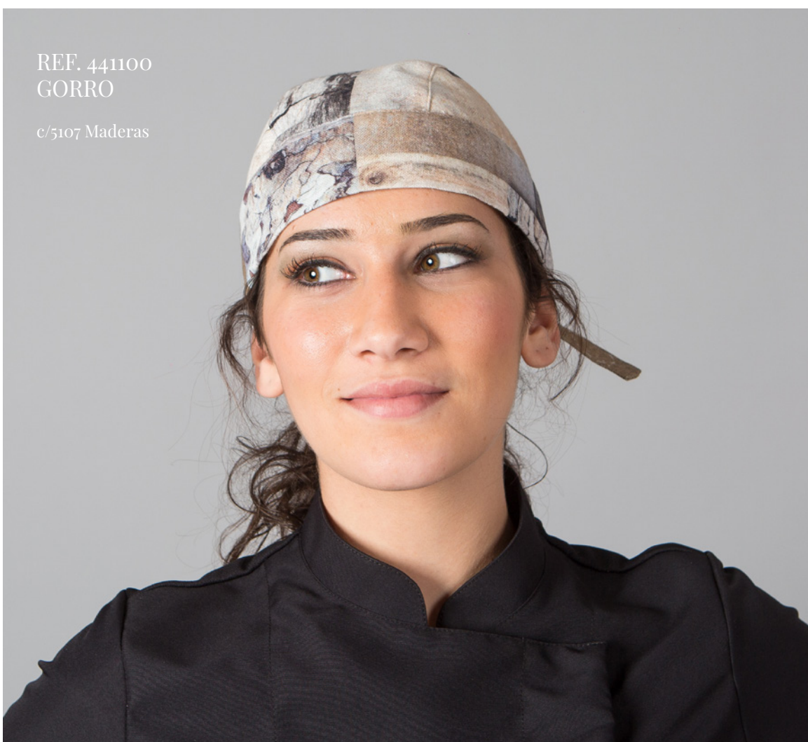
REF. 441100 GORRO