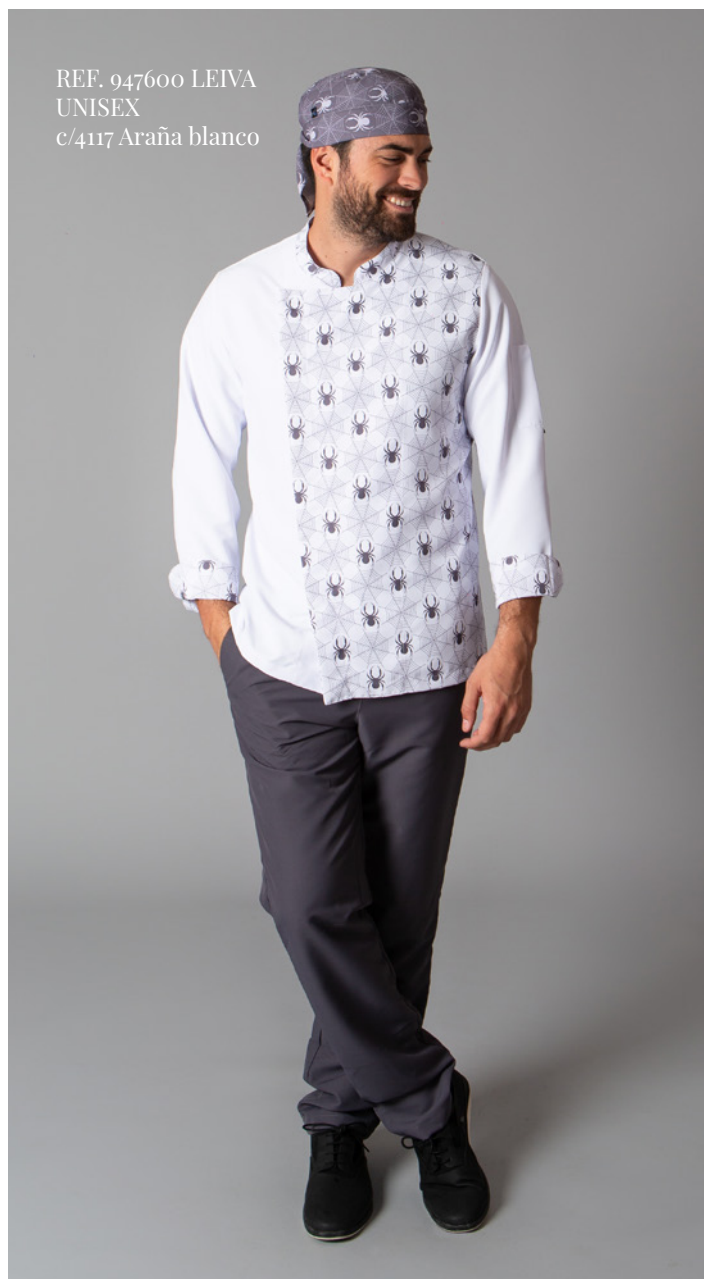
REF. 947600 LEIVA UNISEX c/4117 Araña blanco