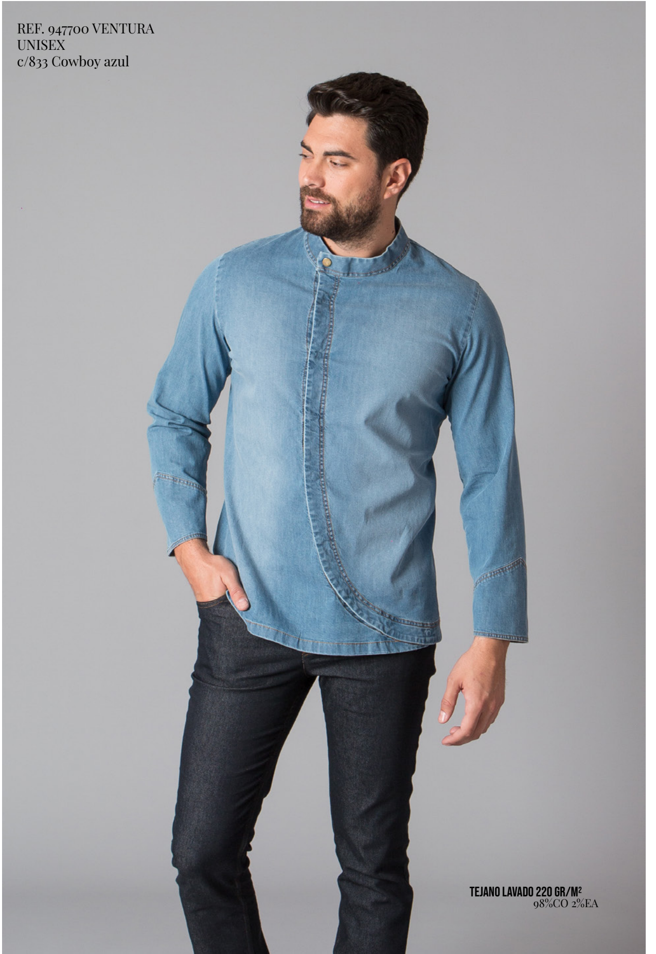
TEJANO LAVADO 220 GR/M 2 98%CO 2%EA