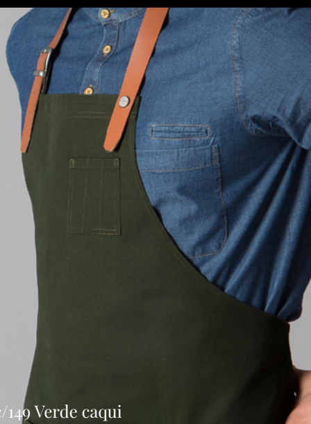
c/149 Verde caqui