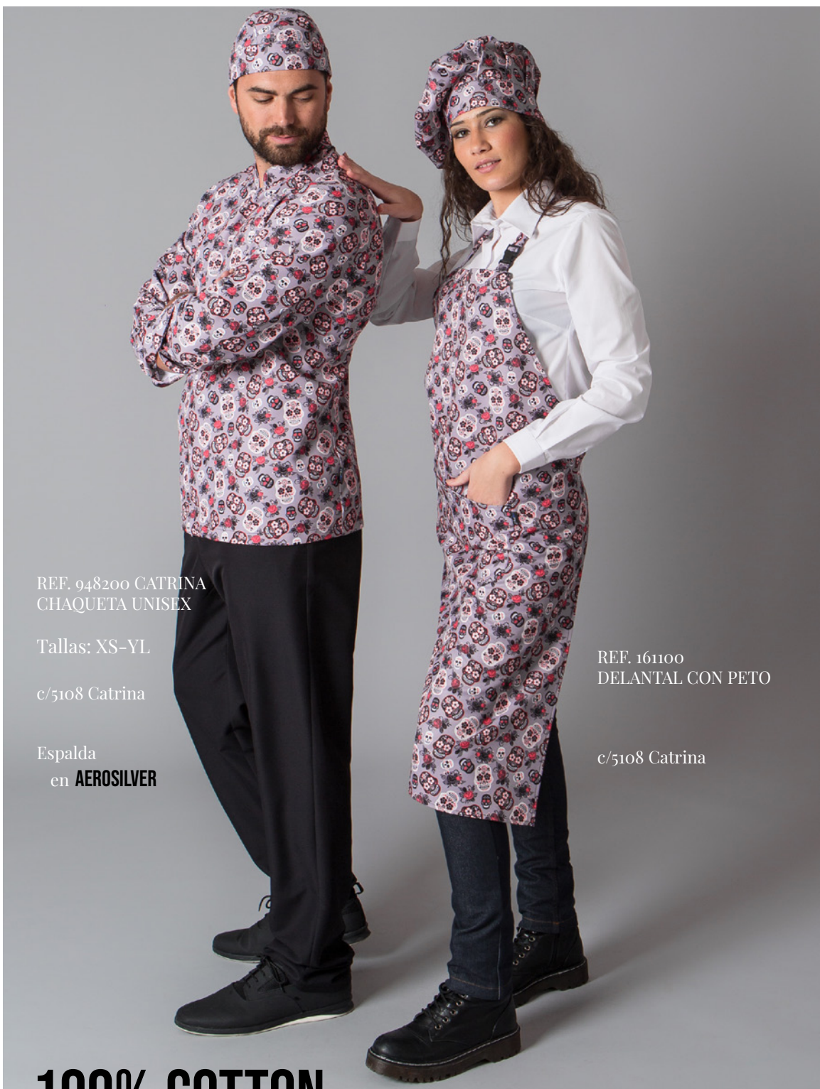
REF. 948200 CATRINA CHAQUETA UNISEX