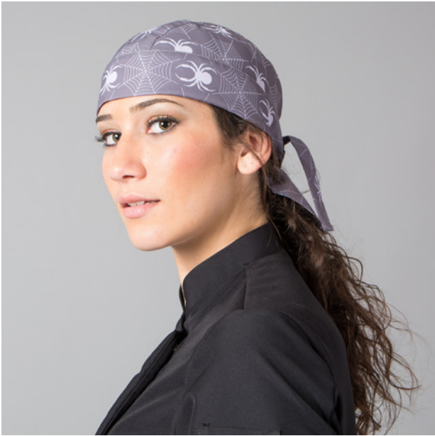
(Mismo código de color para gorros y pantalones)