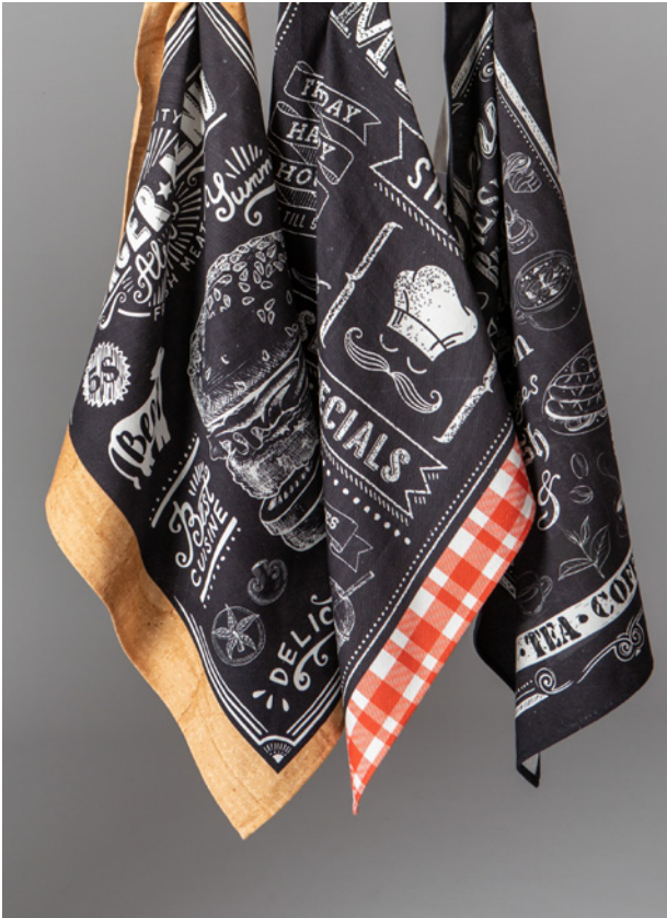
REF. 310100 PACK 3 PAÑOS DE COCINA c/5109 100% CO - SARGA 210 GR./M2