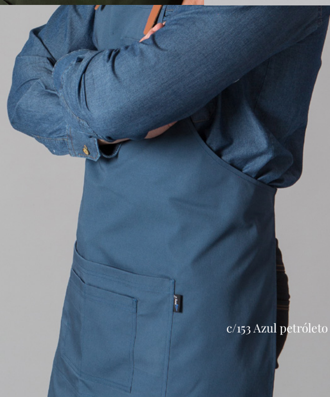
c/153 Azul petróleo