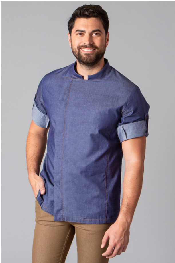
TEJANO 128 GR/M 2 100%CO