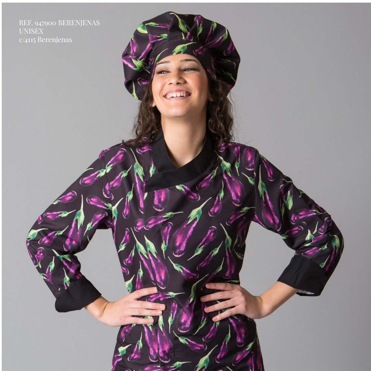
REF. 947900 BERENJENAS UNISEX c/4115 Berenjenas