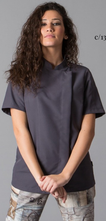
c/139 Gris marengo