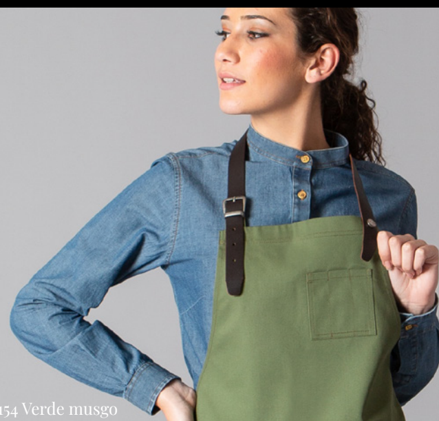
c/154 Verde musgo