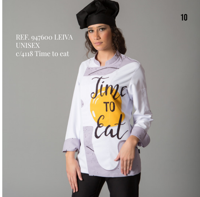
REF. 947600 LEIVA UNISEX c/4118 Time to eat