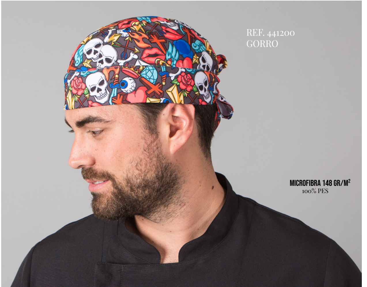
REF. 441200 GORRO